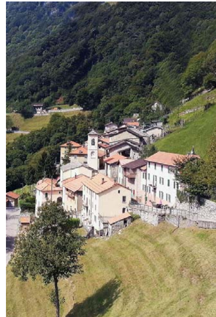
Scudellate in valle di Muggio