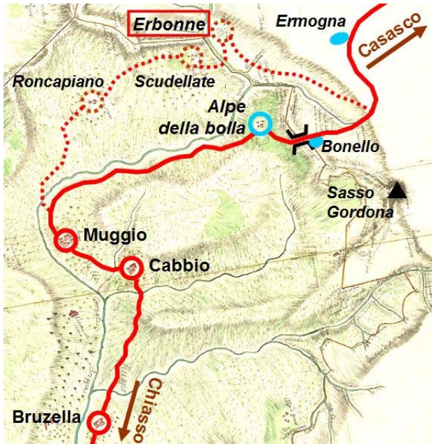
Elaborazione dalla mappa di Pietro Neurone (1780)

Per il Basso Medioevo sappiamo invece, dagli Statuti Comunali di Como, che nel 1335 una strada pubblica univa Chiasso con Casasco, partendo dal ponte della Roda , attraverso la valle di Muggio, fino alla “ pessina ”, situata tra Muggio e Casasco (... usque ad pessinam que est inter mugium et casaschum... ) 14 ; una possibile variante poteva forse passare per Roncapiano, Scudellate ed Erbonne .