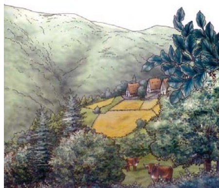
Erbonne: ricostruzione grafica del villaggio della tarda Età del Bronzo (da CASTELLETTI 2008)

L'ascia di Erbonne è uno dei pochi reperti relativi alla Prima Età del Ferro rinvenuti in Valle Intelvi 8 .