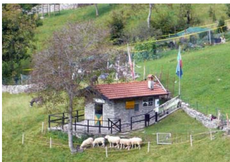
Il “museo del contrabbando” di Erbonne

In base alla sua storia, per Erbonne potremmo quindi dire: "Valle Intelvi... ma non troppo!".