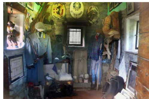
L'interno del piccolo museo