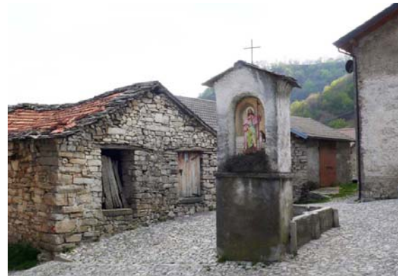
La "piazzetta" di Erbonne

Oltre ai ritrovamenti di selci musteriane (Paleolitico Medio) relative all' uomo di Neandertal rinvenute nella non lontana Caverna Generosa e risalenti a 60000-40000 anni fa , le prime tracce di frequentazione umana del sito di Erbonne risalgono al Mesolitico recente (6500-5500 a.C.) .