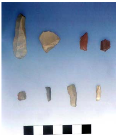
Erbonne: microselsci del tardo Mesolitico (da CASTELLETTI 2008)