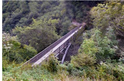
Erbonne. Il ponte moderno (2005) lungo la via per Scudellate. Ha sostituito un antico guado più a valle

A nulla valse l’affermazione da parte del comune di S. Fedele che Erbonne non sarebbe stato più da considerarsi un alpeggio, bensì una frazione del suddetto comune.