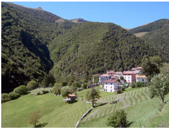
Erbonne visto dalla strada proveniente da Casasco

Erbonne, attualmente frazione del comune Centro Valle Intelvi (un tempo lo era di S.Fedele Intelvi), è un minuscolo abitato situato nell'alta val Breggia (valle di Muggio), alla quale appartiene geograficamente e culturalmente: ancora alla fine del XIX secolo Erbonne fungeva da alpeggio per il paese svizzero di Muggio, da cui dipendeva pure per la maggior parte delle pratiche religiose e civili.