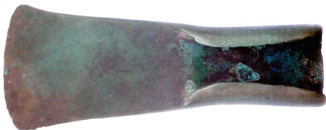
Erbonne: ascia in bronzo ad alette terminali (VIII-VII sec. a. C.) (da CASTELLETTI 2008)

Per la prima Età del Ferro, sempre a Erbonne , fu rinvenuta un' ascia in bronzo ad alette terminali dell'VIII-VII sec. a.C. 6 , di una tipologia tipica forse del bresciano, ma diffusa nel territorio golasecchiano, a conferma che la zona intelvese era partecipe dei mutamenti culturali in atto 7 .