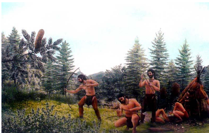
Erbonne: ricostruzione grafica di un bivacco di cacciatori mesolitici (da CASTELLETTI 2008)

Relativamente alle nostre zone, mentre per il Bronzo Recente e Finale si hanno reperti a Rovio (necropoli) 3 e al Caslé di Ramponio (dove sorse un castelliere) 4 , proprio a Erbonne il Museo di Como ha individuato i resti di un insediamento probabilmente pastorizio 5 .