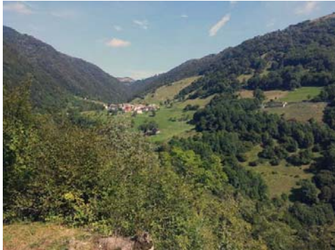
Erbonne visto dalla via che porta a Scudellate

Quando nel 1876 il comune di S.Fedele pretese una tassa sul pascolo del bestiame, gli alpeggiatori di Erbonne (residenti a Muggio) si opposero ed ebbero vinta la causa, in quanto il comune intelvese (cui la minuscola frazione apparteneva), non vi provvedeva minimamente: non c'era una strada decente, mancavano il prete, la chiesa, la scuola e il medico; i nati e i morti venivano registrati presso la parrocchia di Scudellate (Muggio), ove si seppellivano anche i cadaveri dei defunti, portandoveli a spalla attraverso un sentiero impervio ancora oggi percorribile, che guada il torrente Breggia (più a valle del moderno ponte in legno del 2005).