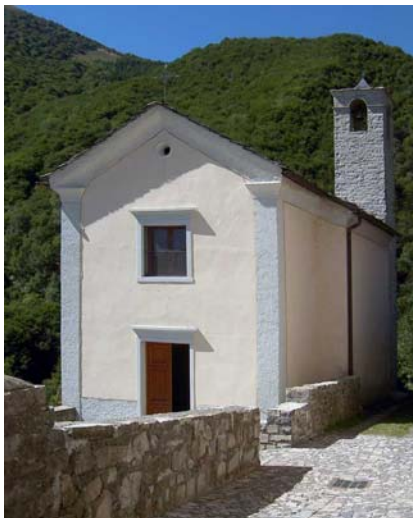
La chiesa di Erbonne costruita nel 1923

Relativamente alla Seconda Età del Ferro (Cultura di La Tène) a Erbonne , mentre si costruiva la chiesa nel 1923, si rinvenne una tomba gallica romanizzata , con vasetti e una moneta in bronzo del III-II sec. a.C. 9 .