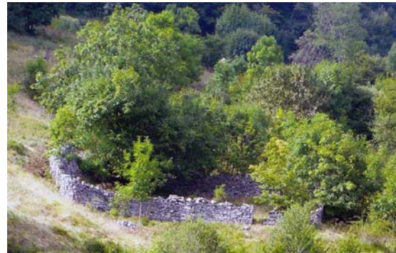
Il recinto di Erbonne

Si tratta di manufatti estremamente rari nelle nostre zone, da preservare da una possibile progressiva distruzione dovuta all'incuria.