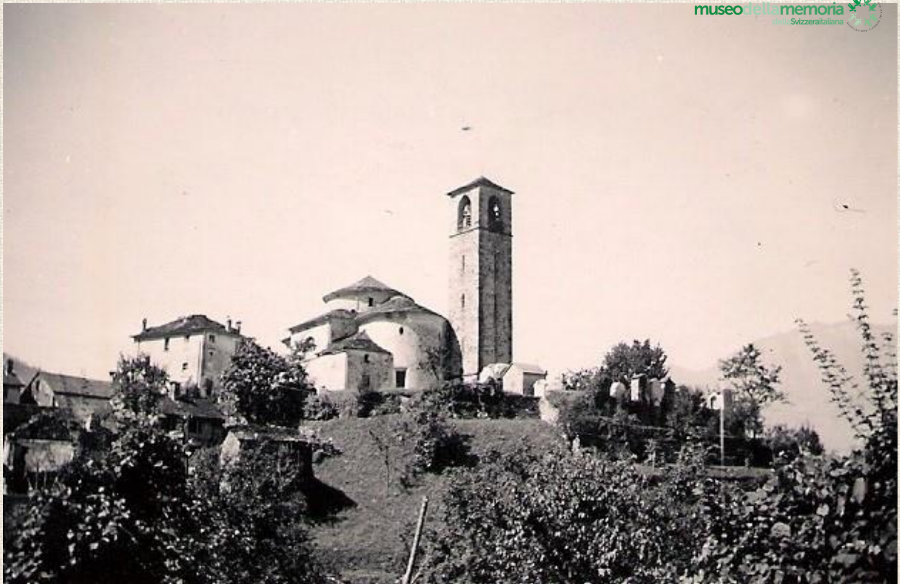
6 Ranzo, chiesa dei SS. Abbondio e Andrea