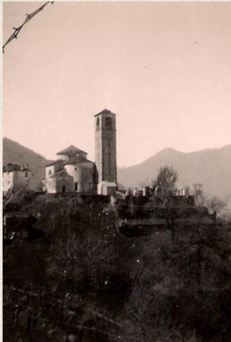
5 Ranzo, chiesa dei SS. Abbondio e Andrea