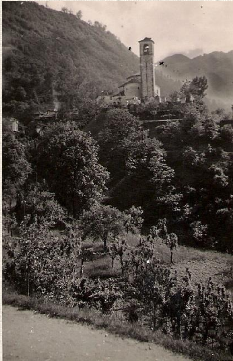
3 Ranzo, chiesa dei SS. Abbondio e Andrea