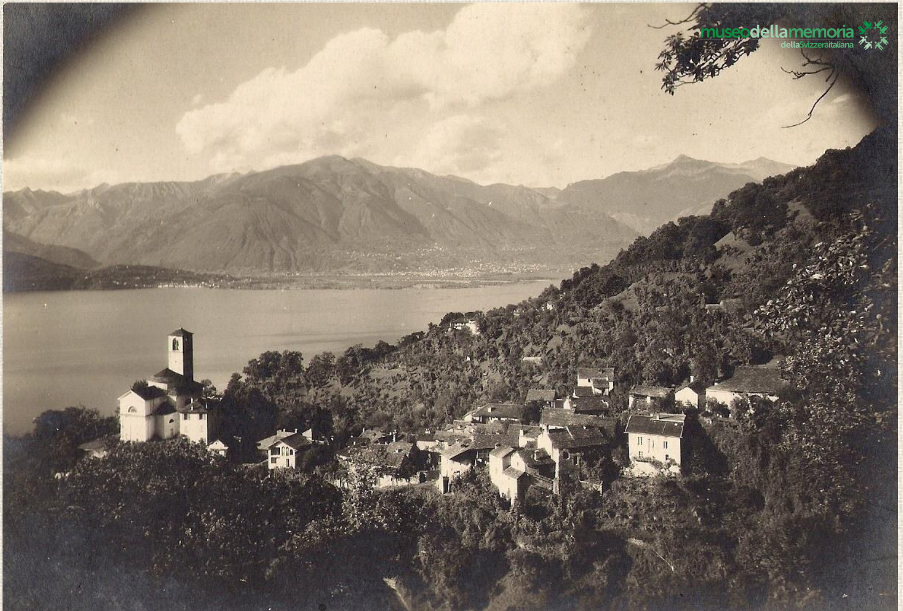
7. Ranzo, la magnifica posizione della chiesa dei SS. Abbondio e Andrea adiacente al paesino omonimo