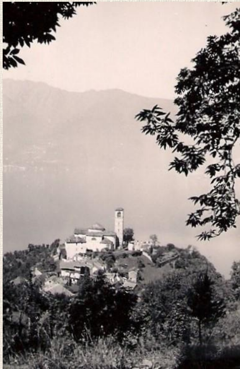
2 1938 - Ranzo, chiesa dedicata ai Santi Abbondio e Andrea.