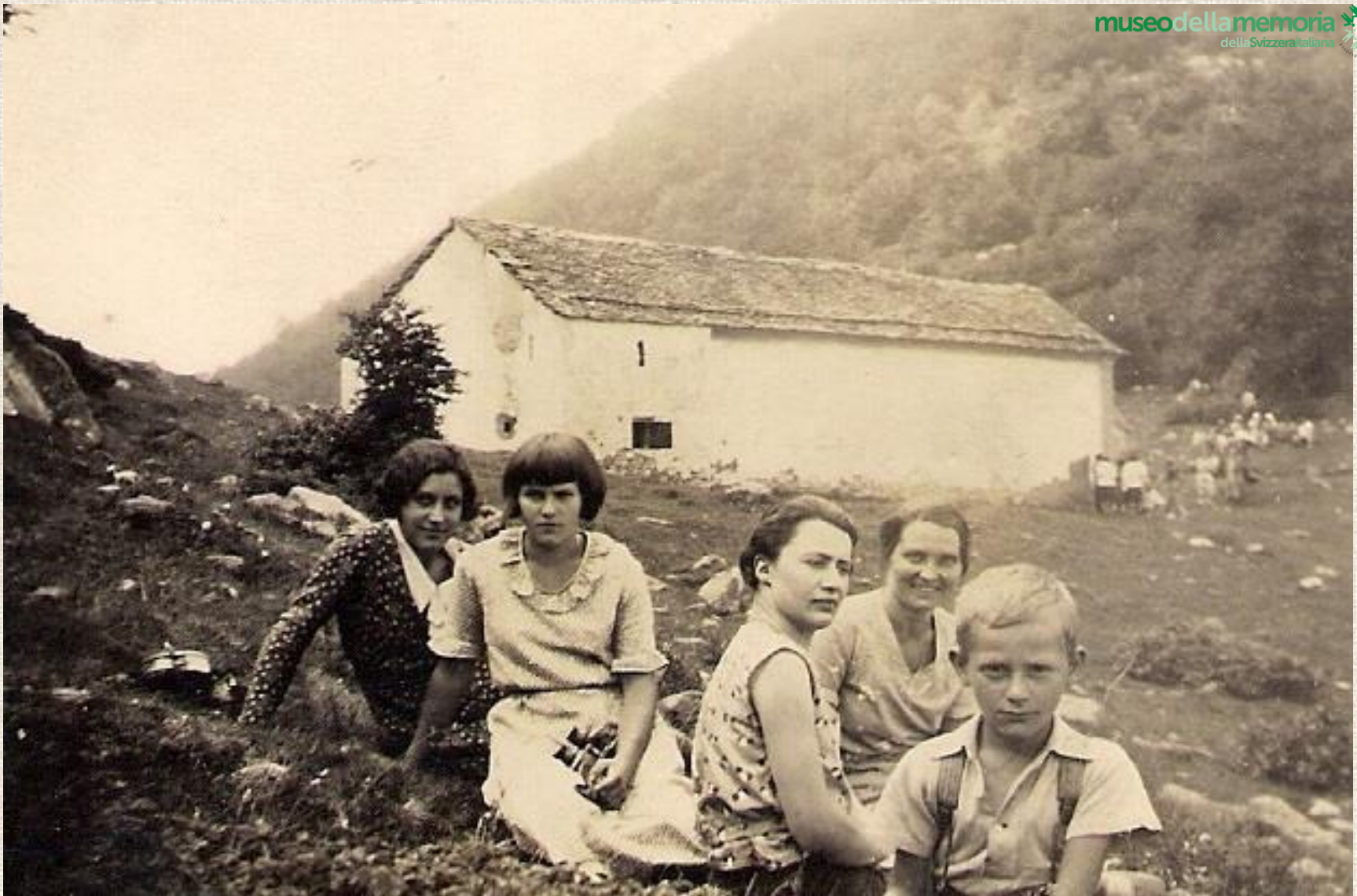
3 Indemini, Alpe Cedullo, giorno della festa di Sant'Anna a fine luglio.