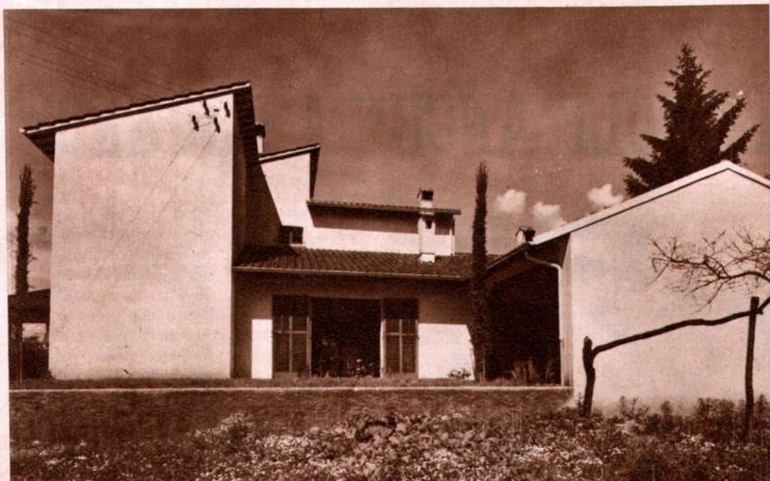
La parte posteriore della casa col giardino e il portico-terrazza. Di fianco : Un angolo della sala di soggiorno; gli altorilievi in stucco del caminetto e le ceramiche sono opera dell'architetto pittore Schmid.