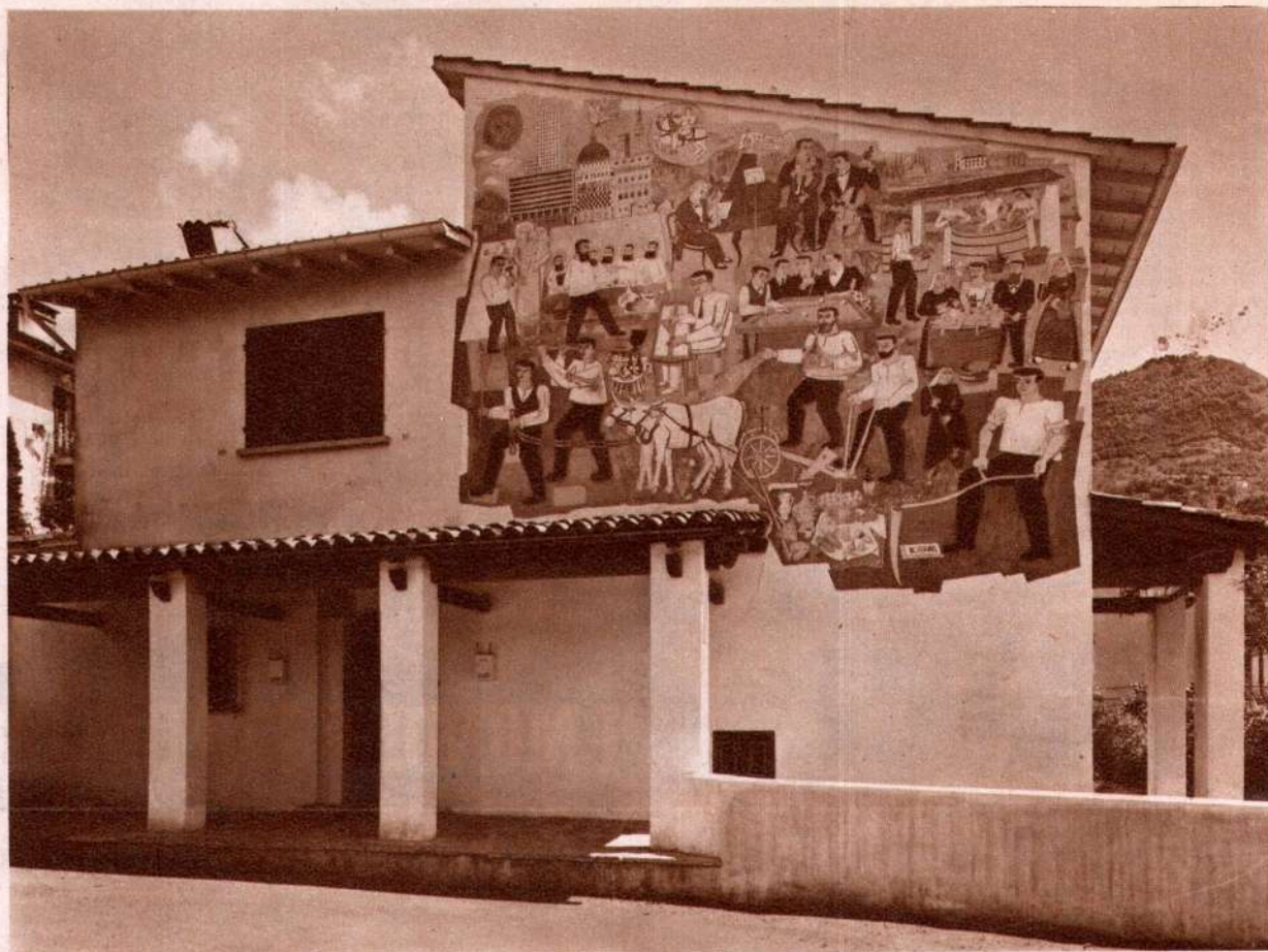
La facciata che dà su Via degli Orti col fantasioso affresco del pittore Wilhelm Schmid che è tutto un inno alla vita e al lavoro.