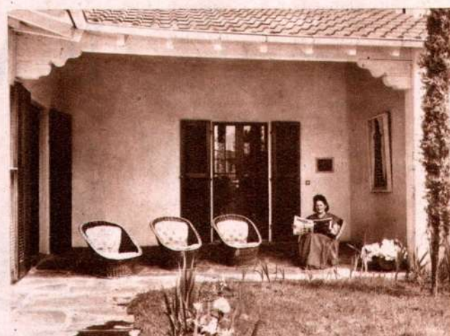
Il portico che unisce il giardino alla casa.

d'accesso danno sulla via e fanno da cuscino al cuore della casa con i diversi locali aperti sul giardino. Pittore e colorista di fama, Wilhelm Schmid argoviese d'origine, ma ticinese ormai d'elezione, si fece un nome a Berlino ove ebbe campo altresì di farsi conoscere come architetto. Il senso del colore netto e pulito e vivo che è dei suoi quadri, la sicura e salda e sempre equilibrata impostazione delle masse ha guidato anche l'architetto, tanto che l'esterno come l'interno dell'edificio spiccano per una insolita proporzione dei vuoti e dei pieni; proporzioni felicissime che hanno saputo creare scorci, angoli, ambienti di raccolta poesia.