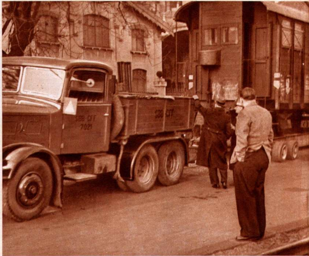
Sopra: Il carrello trasportatore, munito di ben 16 ruote. Di fianco: la potente trattrice a motore Diesel di 100 HP. Sotto: Il convoglio in salita. Noteremo ancora che la velocità di corsa varia dai 5 ai 15 km. orari e che possono essere superate salite a carico pieno sino a pendenza dell'8,7 %.