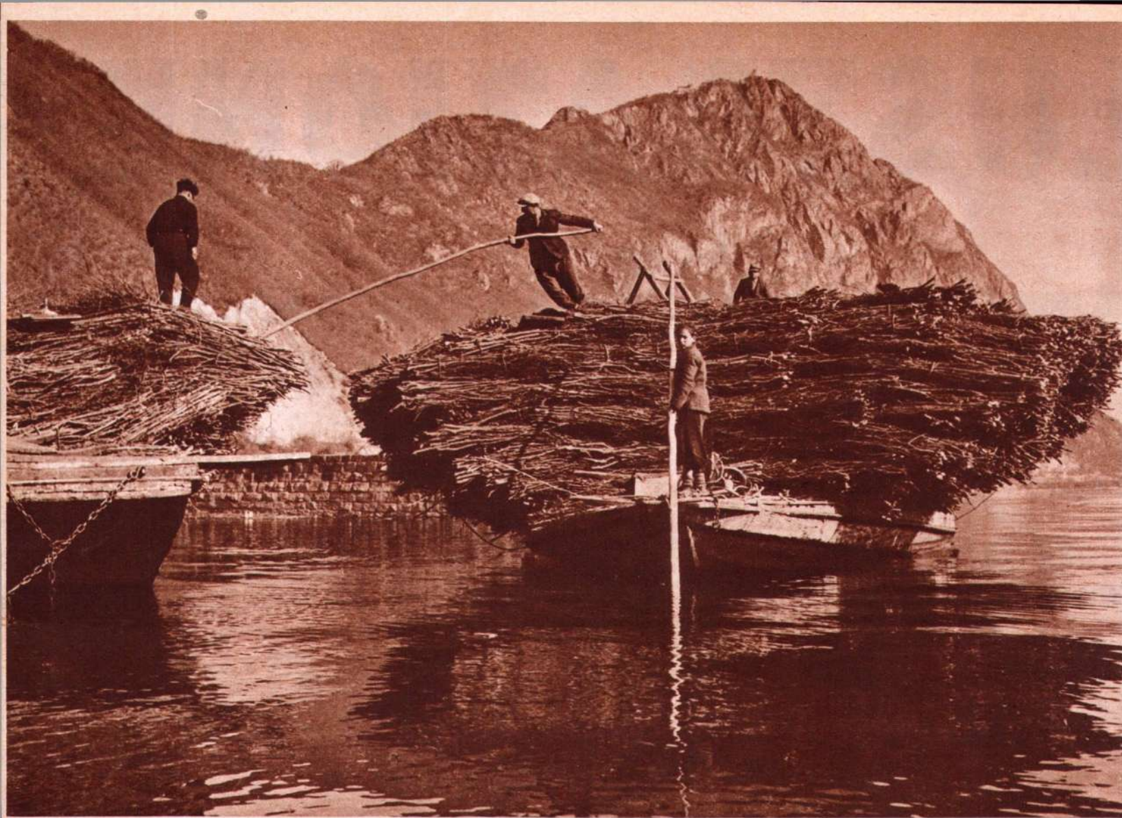
Un barcone carico sta per approdare. Sotto: le fascine sono portate a terra.