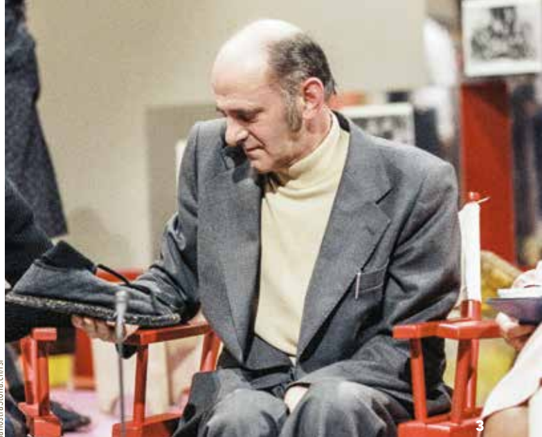
la nostra storia.chivrisi

Il maestro di Cavergho aveva da tempo lasciato la scuoletta del paese e aveva accolto l'invito di Virgilio Gilardoni di trasferirsi al Negromante di Locarno, dove il mitico Gil svolgeva la propria attività. Gilardoni, oltre che riconosciuto intellettuale, era astuto e