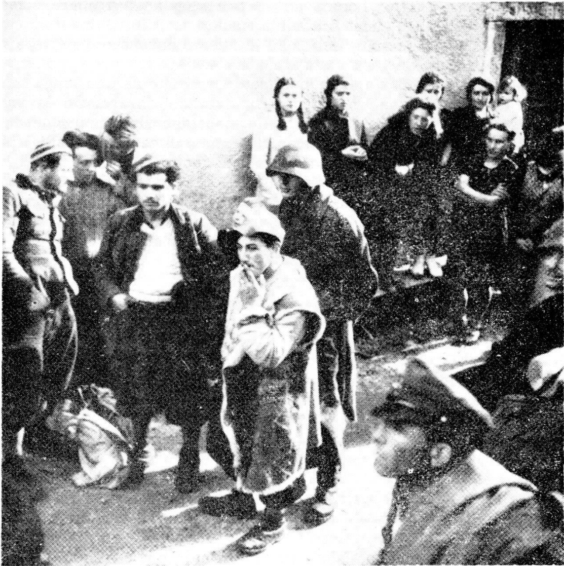
Spruga, ottobre 1944: i partigiani entrati in territorio svizzero, scampati al rastrellamento nazi-fascista, vengono portati a Locarno dall'esercito svizzero.

direttrice Craveggia-bocchetta di Sant'Antonio-Bagni di Craveggia. Chi ha visto solo una volta il posto si rende conto che per i fascisti, in posizione dominante, sarebbe stato facilissimo avere ragione di quella povera gente, imbottigliata nel classico cul di sacco.